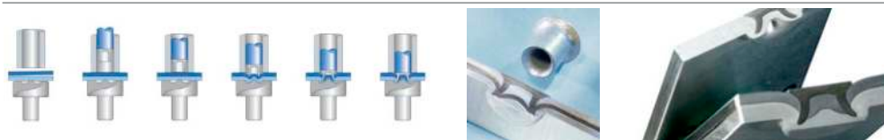
◀ Rivetti auto perforanti Self Piercing Rivets

IDEAL FOR AUTOMOTIVE REPAIR USING (SPR) SELF PIERCING RIVETS, FLOW FORM RIVETS, BLIND RIVETS.