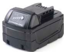
▲ Batteria Battery